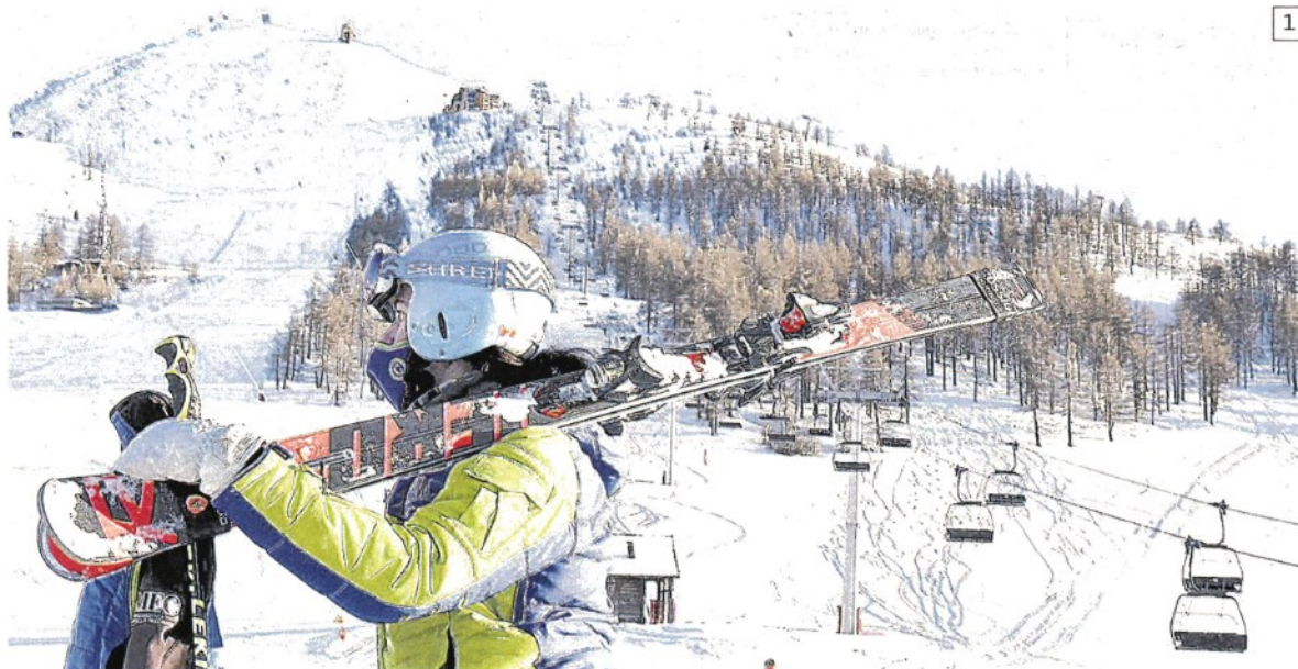
1 Un'immagine dello scorso 11 febbraio degli impianti sciistici del Sestriere chiusi per l'emergenza coronavirus