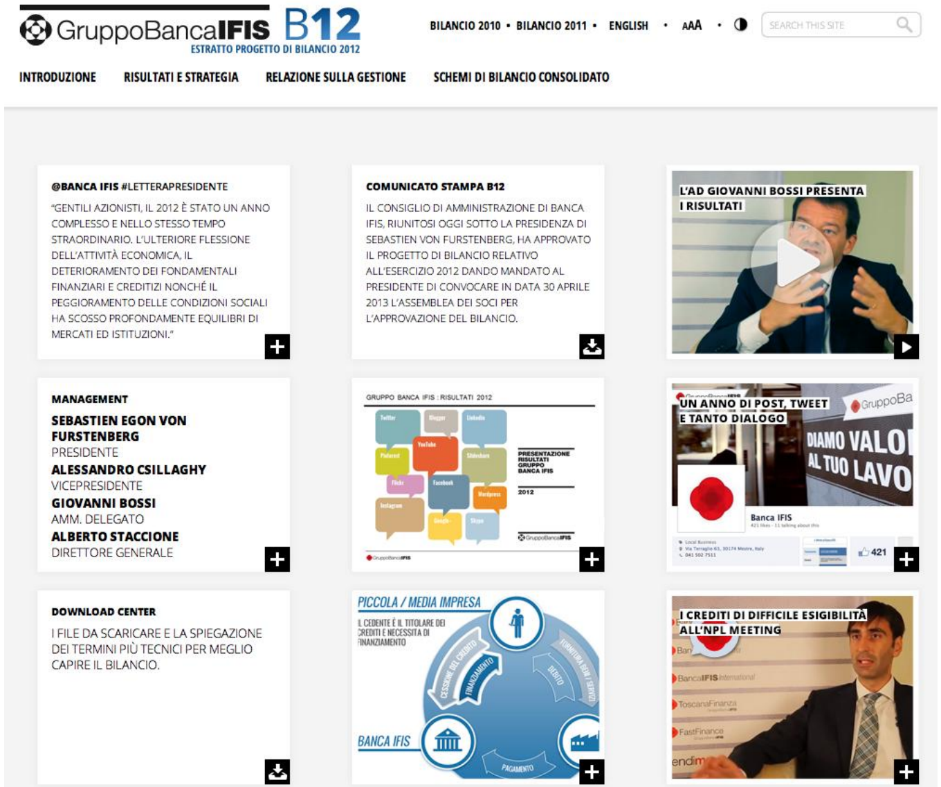
Figura 1: Homepage del bilancio interattivo di Banca IFIS.